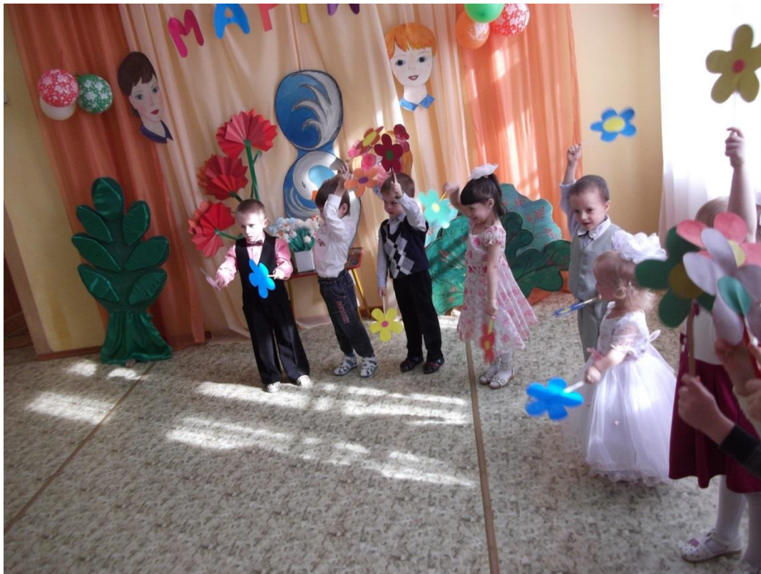
Танец с цветами