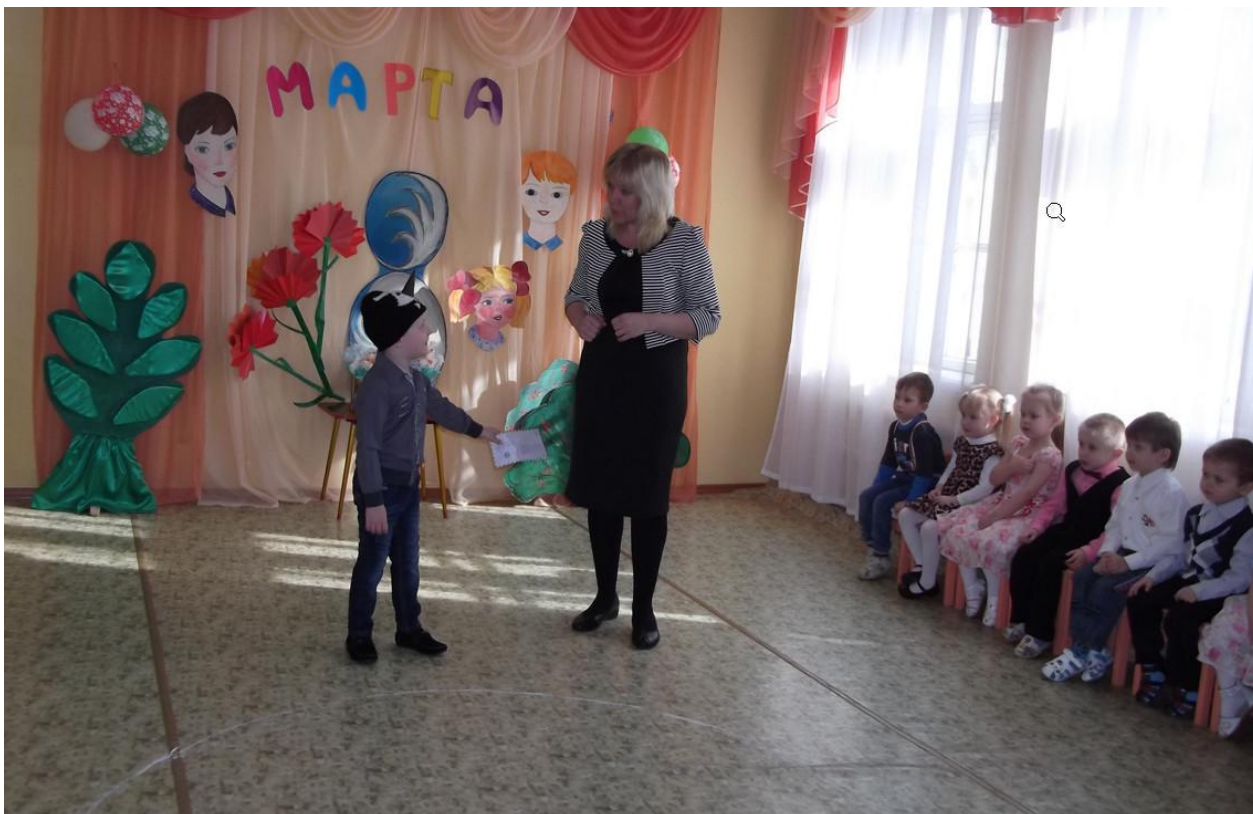
Нежданным гостем стала Баба-Яга.