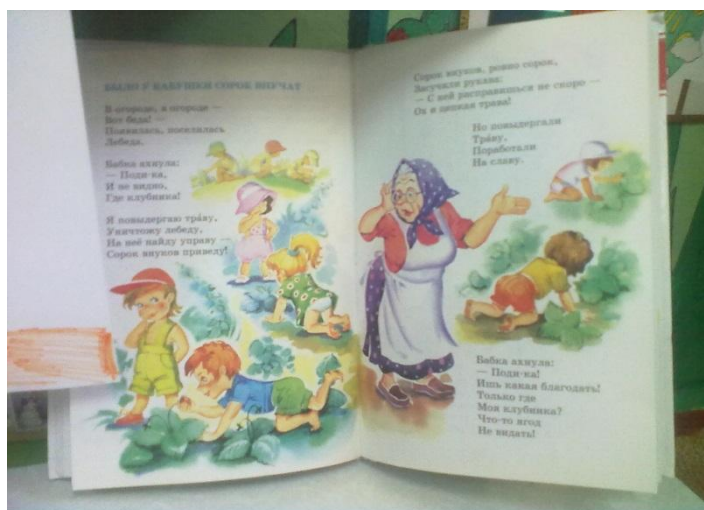
Книжки о бабушке