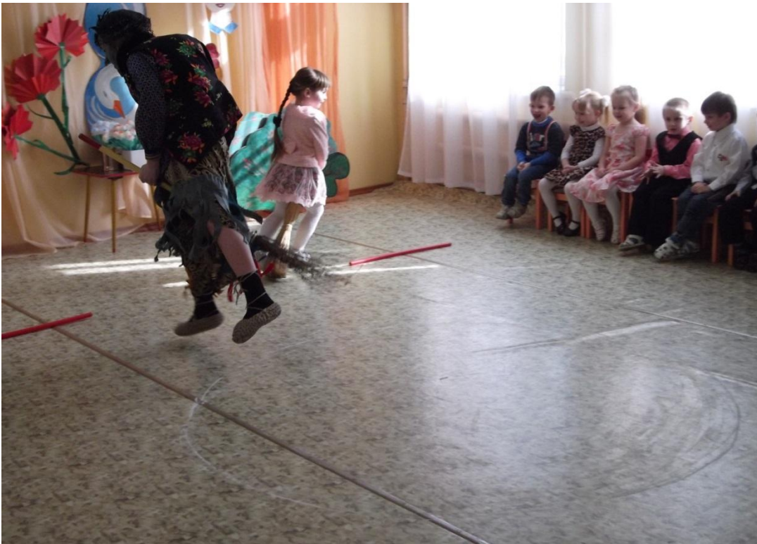
Игра «Верхом на метле»