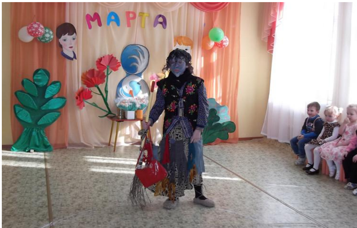
«Шла я лесом мимо кочек, и нашла там колокольчик! Он такую трель завел и сюда меня привел!» - поделилась лиса.