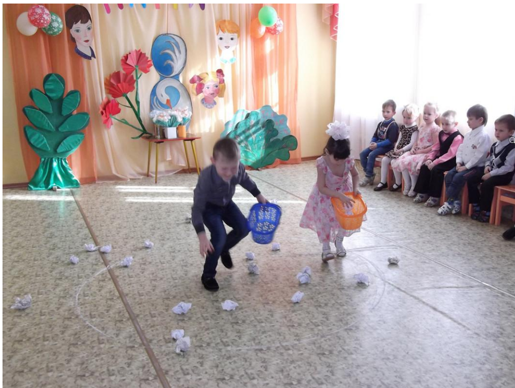
Игра «Помогаем бабушке»