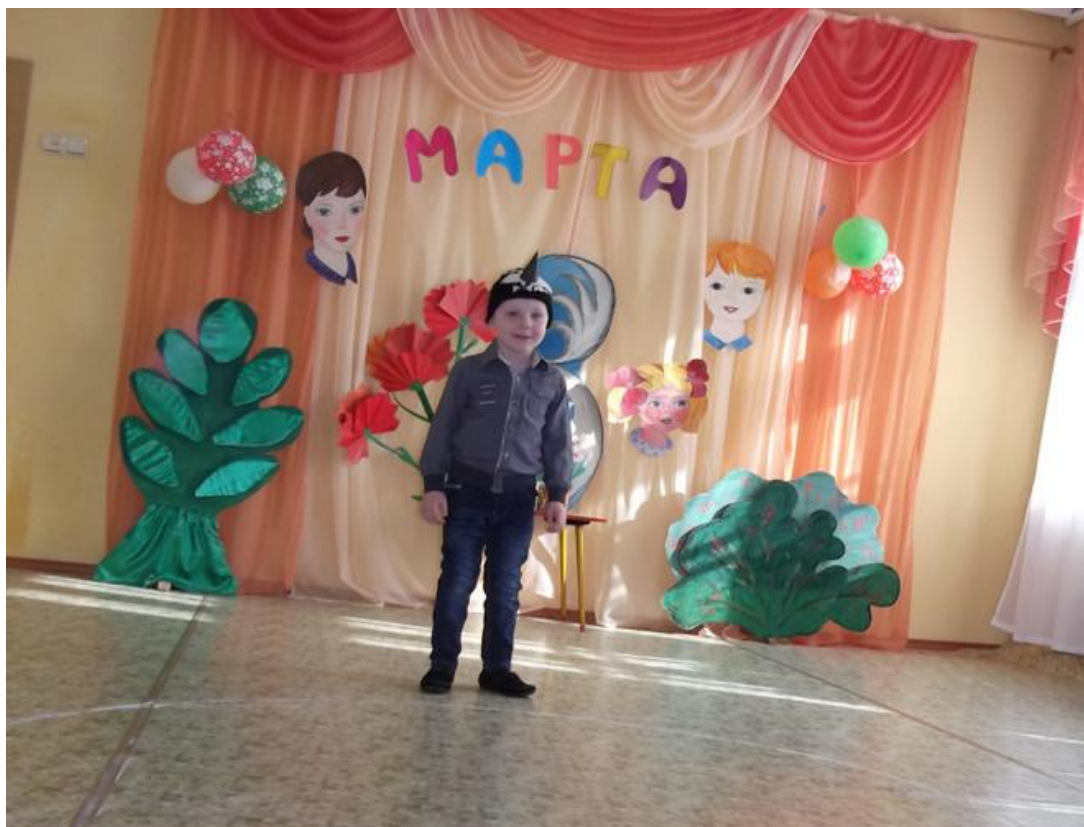
А ещё к нам прилетал вестник весны Скворец – красивых песен творец.