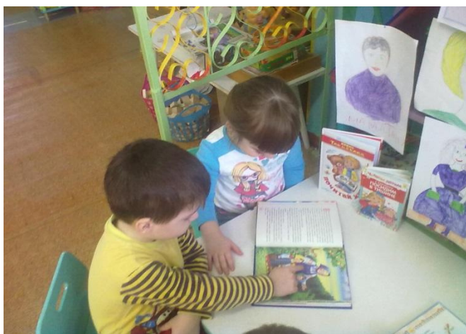
Читаем о маме