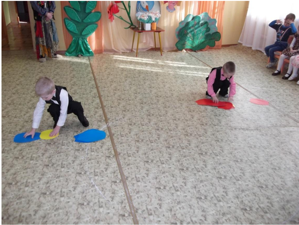
Игра «Собери цветок»

У наших девочек состоялся дебют. Они исполнили замечательный танец с ленточками.