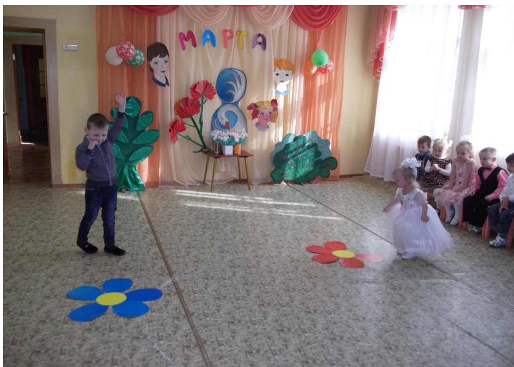
Игра «Собери цветок»