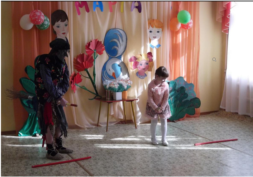
Игра «Верхом на метле»