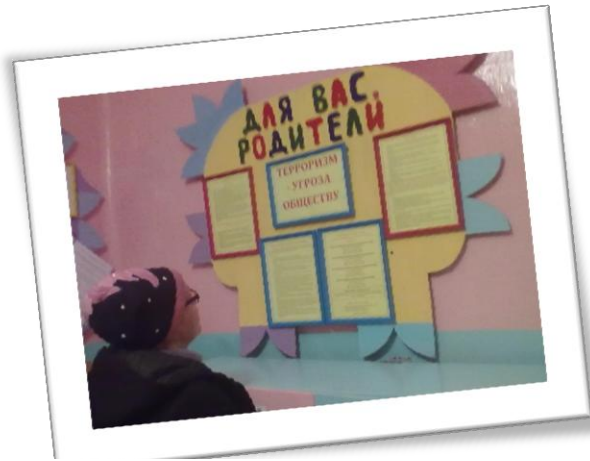
Родители знакомятся с материалами уголка