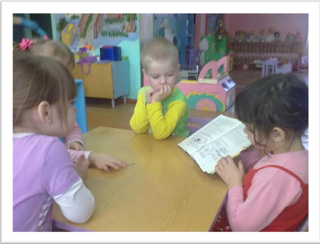
Рассматривание картинок по ОБЖ