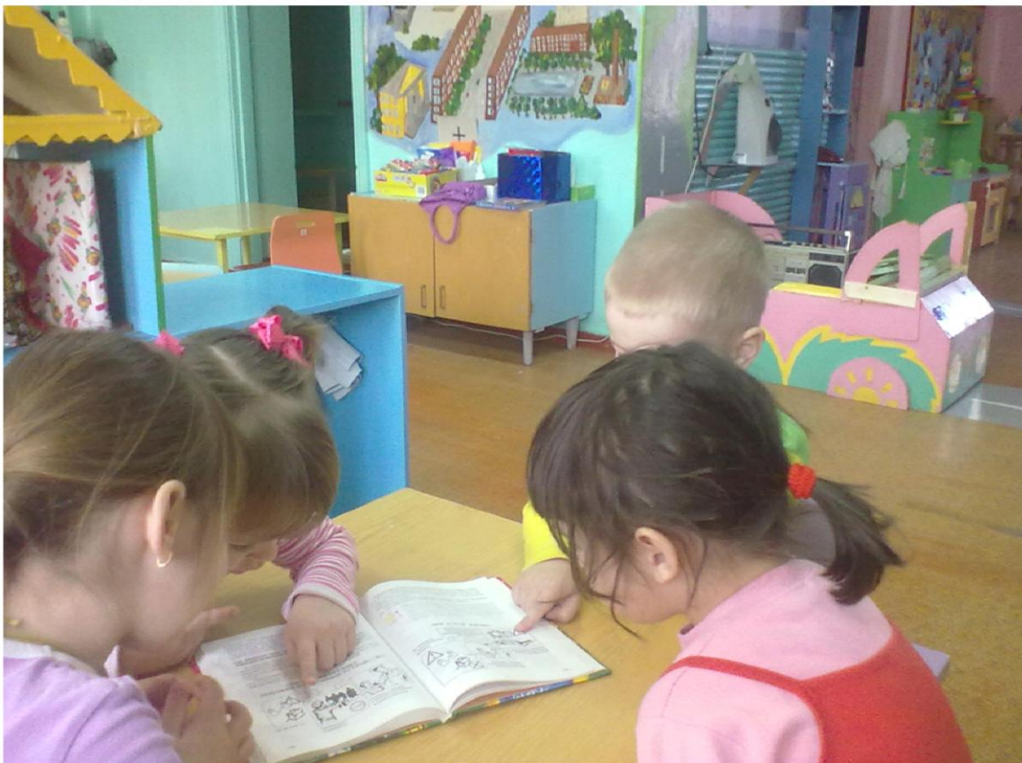
Рассматривание картинок по ОБЖ