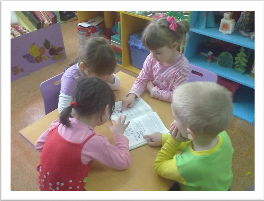
Рассматривание картинок по ОБЖ